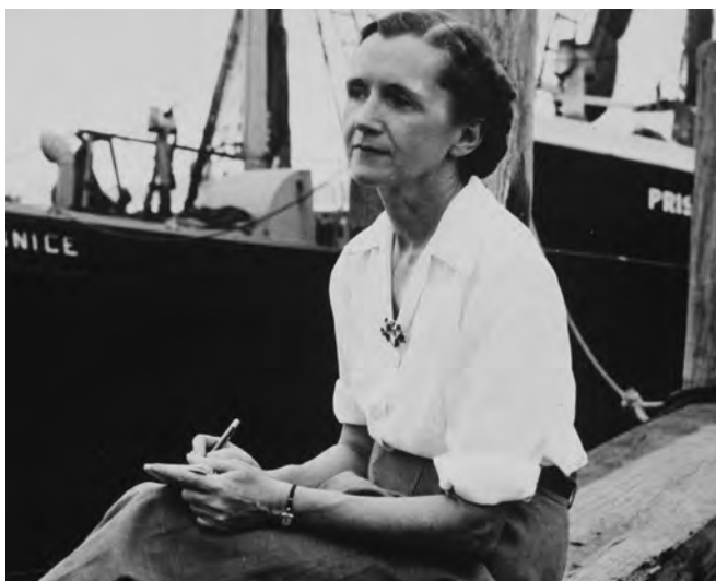
Rachel Carson nel 1951 dopo la pubblicazione di The Sea Around Us 35

La comprensione si raggiunge solo quando, stando su una spiaggia, [...] riusciamo a percepire con la vista e l’udito della mente l’impeto della vita che preme, ciecamente, inesorabilmente, per un appiglio sulla riva 34 .