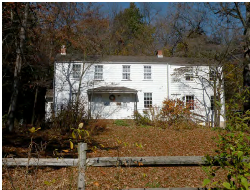
Casa natale di Rachel Carson 10